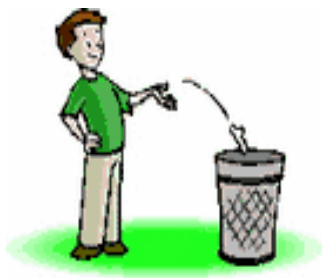
rēng lājī 扔垃圾