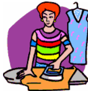
yùn yī fu 熨衣服