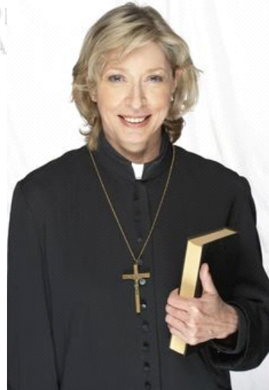
mù shī 牧师