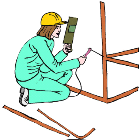
jiànzhùgōng rén 建筑工人